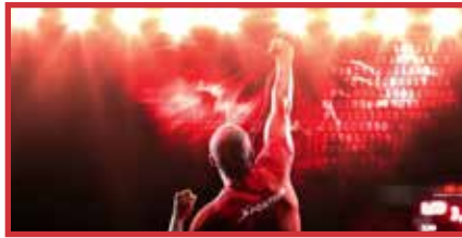
Spot de la temporada 2018-2019