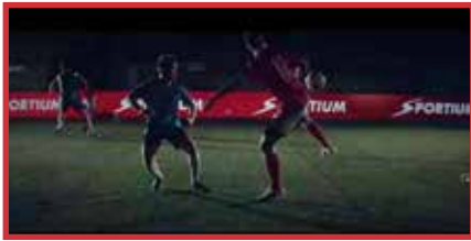
Spot de la temporada 2017-2018

Sportium se caracteriza por una comunicación basada en los valores y rasgos diferenciales de la compañía. En nuestras campañas de las últimas temporadas hemos apelado a la tecnología, la multicanalidad y los valores del deporte, en colaboración con LaLiga como partner , haciendo referencia a conceptos como la lucha, la superación, la igualdad y el trabajo en equipo, poniendo siempre el foco en los clientes como punto esencial de nuestra campaña.