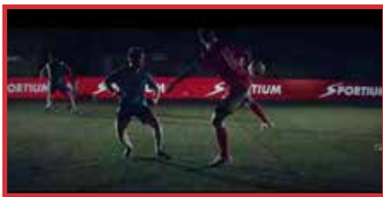
Spot de la temporada 2017-2018

Sportium se caracteriza por una comunicación basada en los valores y rasgos diferenciales de la compañía. En nuestras campañas de las últimas temporadas hemos apelado a la tecnología, la multicanalidad y los valores del deporte, haciendo referencia a conceptos como la lucha, la superación, la igualdad y el trabajo en equipo, poniendo siempre el foco en los clientes como punto esencial de nuestra campaña.